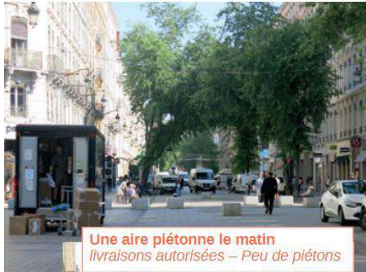
Une aire piétonne le matin livraisons autorisées – Peu de piétons