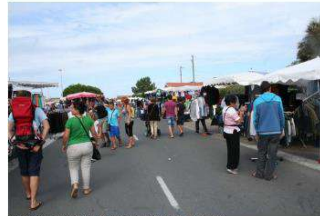
© Corine Pin Consultante mobilité - Agoracité