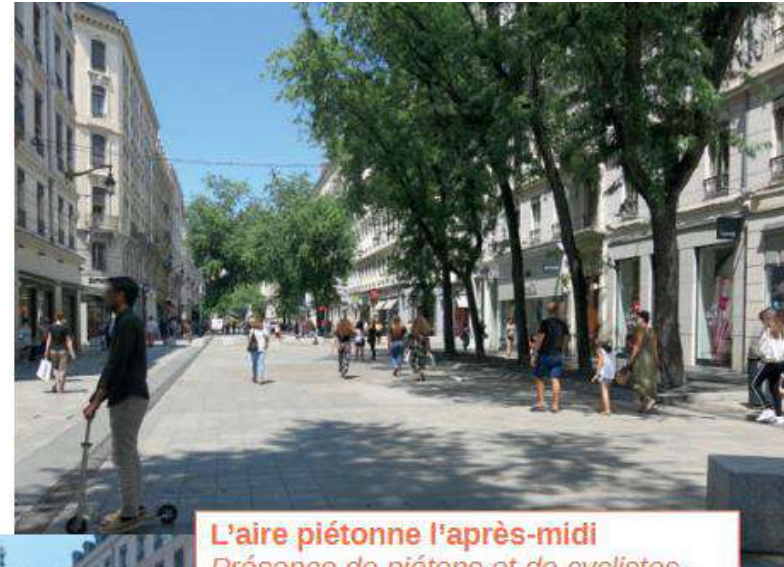
L'aire piétonne l'après-midi Présence de piétons et de cyclistes - Espace public dégagé de la présence des véhicules motorisés